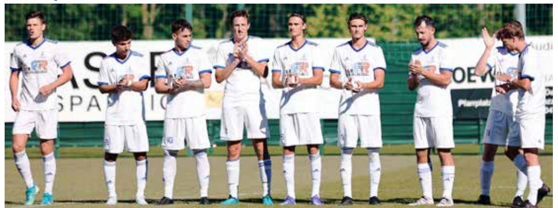
Die Paulsner Jungs sind bereit für ihre 26. Oberligasaison.

St. Pauls – Weinstraße Süd in Rungg um 15.30 Uhr