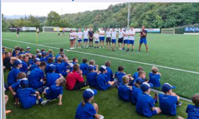
Erschöpft – mehr als 90 junge Fußballerinnen und Fußballer nahmen beim ‚Spiel, Spaß, Spiel & Fußball‘-Camp des FC St. Pauls .

Am Freitag-Abend wurde das Camp mit einem Turnier abgeschlossen. 10 gemischte Mannschaften standen sich gegenüber und präsentierten Eltern und Fans die Lernfortschritte. Das Camp wurde unterstützt von Huber Hannes Kaminkehrer und City Clinic .