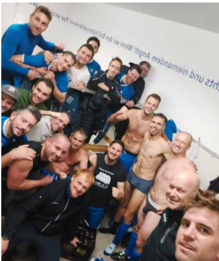
Die Paulsner Freizeit ist in der laufenden Meisterschaft nicht aufzuhalten. Entsprechend gut ist die Stimmung – im Bild nach dem klaren 6:0-Derby Sieg gegen Überetsch.

Auch im Italienpokal der Oberliga ist St. Pauls noch im Rennen. Gegner ist im Halbfinale am Mittwoch, 9. November ab 20 Uhr auswärts Lana . Das andere Halbfinale bestreiten der Bozner FC und Obermais . Es wird nur ein Spiel ausgetragen, bei Unentschieden folgt nach den 90 Minuten ein Elfmeterschießen. Das Landesfinale wird am Samstag, 10. Dezember ausgetragen, das regionale Finalspiel gegen den Oberliga-Pokalsieger aus dem Trentino geht am Samstag oder Sonntag, 17. oder 18. Dezember über die Bühne.