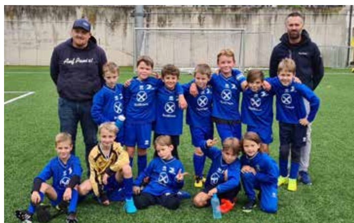
Sind extrem gut drauf und bei ihren Mini-Turnieren auch mit Erfolg unterwegs: Die Paulsner U8-Mannschaft.

dem heimischen Kunstrasenplatz in St. Pauls wertvolle Erfahrung. Dabei steht natürlich nicht der sportliche Erfolg im Mittelpunkt, sondern vielmehr der Spaß und Unterhaltung. Und davon haben die jungen Ballhupfer mehr als genug!