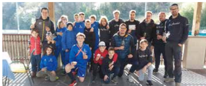
...ein kräftigender Halt bei der Hertha in der Sportbar. Unsere Lieblings-Wirtin verwöhnte die Gruppe mit frischen Krupfen und einem (ersten) Glasl Weißn. Wenig später folgte die nächste Einkehr bei...