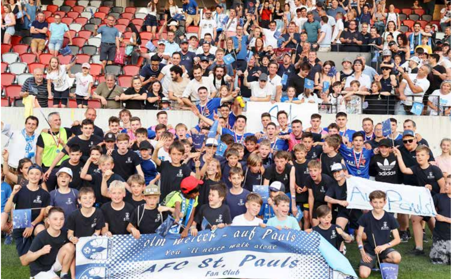
Ein unvergessener Tag: Der FC St. Pauls verlor am 21. Mai 2022 Jahr die erste Auflage des Südtiroler Landespokals gegen St. Georgen im Bozner Drususstadion 1:2, eroberte dank der unglaublichen Unterstützung seiner 500 mitgereisten Fans aber die ganzen Südtiroler Fußball-Sympathien.

Was für ein Abend! Was für eine Dramatik! Was für ein Sieg! Und das augerechnet beim Dauerrivalen aus St. Georgen! Bei jenem Verein, der den FC St. Pauls vor einem Jahr bei der Premiere des Südtiroler Landespokals im Finale im Bozner Drususstadion knapp mit 2:1 besiegt hatte.