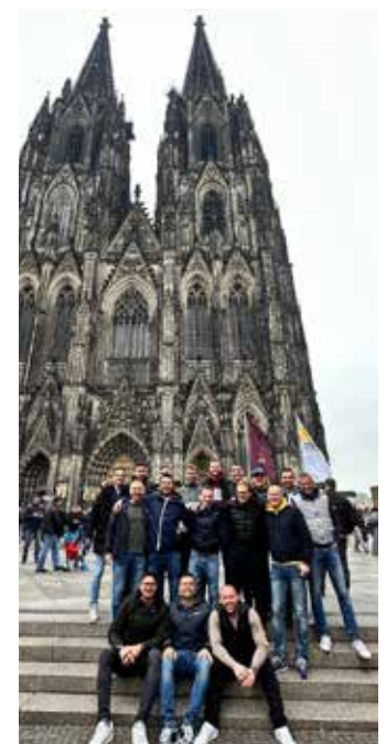
Nicht der Paulsner, sondern der Kölner Dom stand Spalier: Die Paulsner Freizeitmannschaft auf weiter Auslandsreise.

Zwischen der Meisterschaft fanden die Paulsner Freizeitspieler auch noch Zeit für einen kurzen, aber höchst intensiven Abstecher nach Köln. In der deutschen Karneval-Hochburg ließen es gleich 17 Tscheggli-Spieler krachen, dass es nur so tschinderte. Um unzählige Anekdoten reicher und mit zahlreichen Gesangstalenten gesegnet, wurde gesundheitlich und körperlich angeschlagen die Heimreise angetreten. Fazit: Köln war für die Paulsner Tscheggli eine Reise wert.