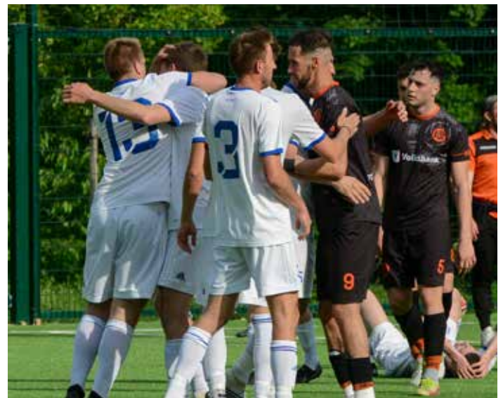
Riesig war die Freude der Paulsner Spieler nach dem 2:1-Auswärtssieg gegen den Bozner FC am vergangenen Sonntag. Gegen Comano heißt es aber nochmal nachlegen – die letzten 90 Minuten der Oberligasaison werden eine ganz schwierige Aufgabe.

Der Termin, der Ort und die Uhrzeit des Landespokal-Finalspiels St. Pauls – SSV Brixen steht noch nicht fest. Fix ist nur, dass es zu gegebenem Anlass eine Sonderausgabe der Blau-Weißen gibt.