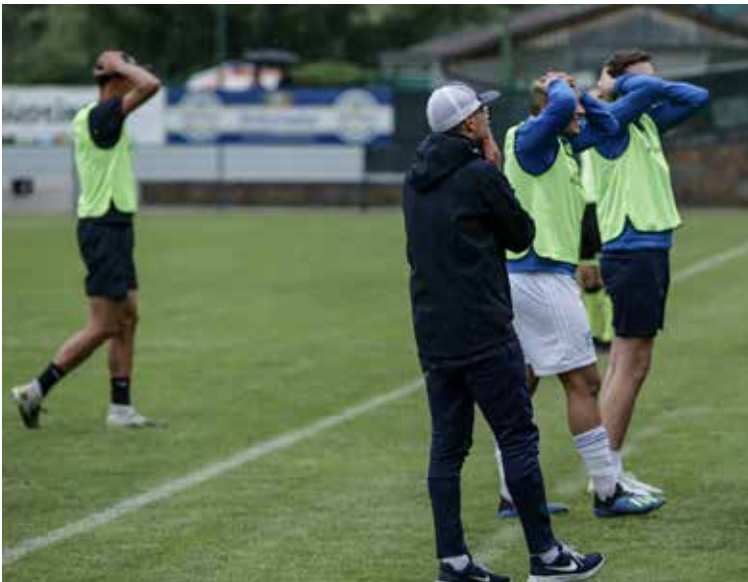
Fassungslosigkeit nach einer der vielen vergebenen Riesenchancen während des Spiels.