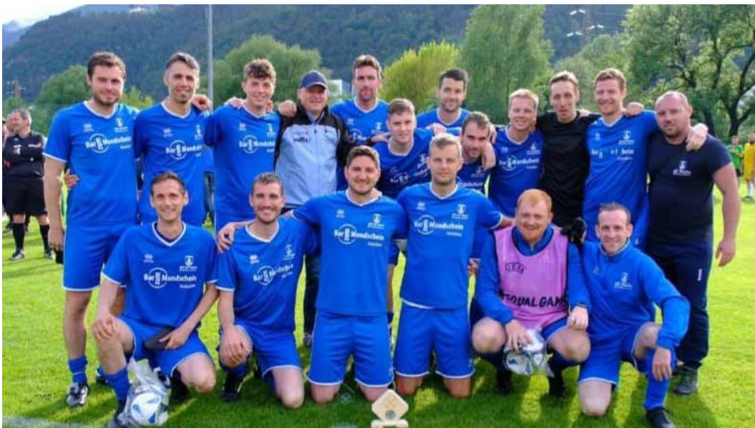
Die Freizeitmannschaft beim Landesfinale 2023

Wo siehst du die Stärken der Mannschaft? Wo gibt es Verbesserungspotential?