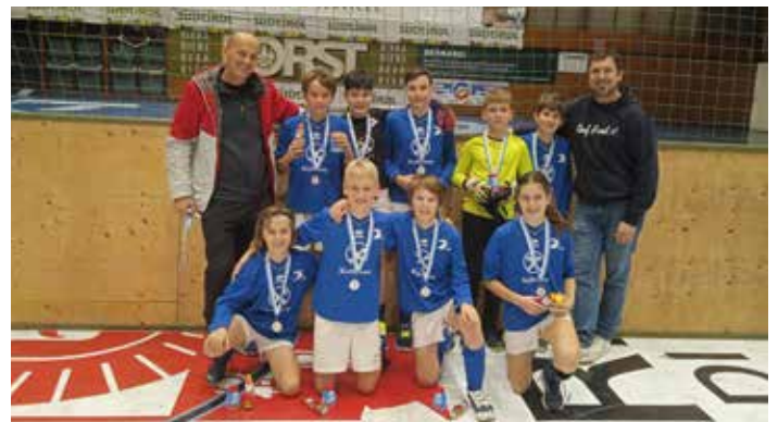
U12 in Brixen

zahlreiche Tore, sondern sorgt für eine besondere Leistungsförderung. Jeder findet in diesem System basierend auf seinem Leistungsniveau die passenden Gegner. Insgesamt wurden im Champions-League-Modus so 42 Spiele absolviert.