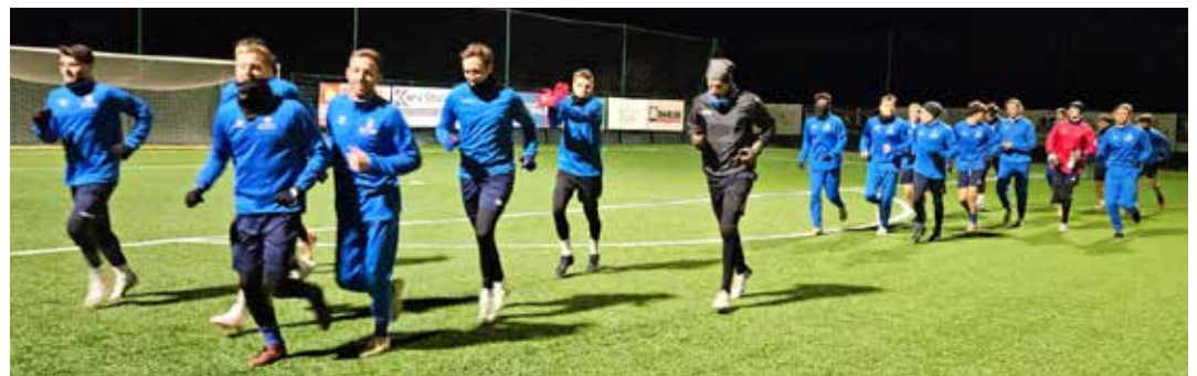
Die Paulsner Oberligafußballer sind seit 2. Jänner wieder im Training und fanden durchwegs gute Bedingungen vor. Sie absolvierten die gesamte Vorbereitung am Paulsner Kunstrasenplatz.

Samstag, 3. Februar: St. Pauls – Partschins um 15 Uhr in St. Pauls Sonntag, 11. Februar: Lavis – St. Pauls um 15 Uhr in Lavis Sonntag, 18. Februar: St. Pauls – Obermais um 15 Uhr in St. Pauls