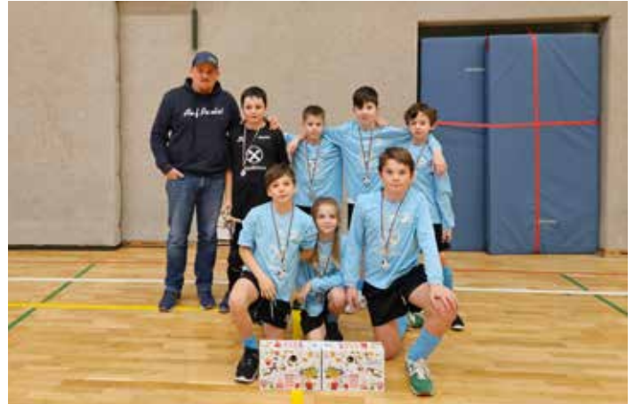
U10 in Eppan