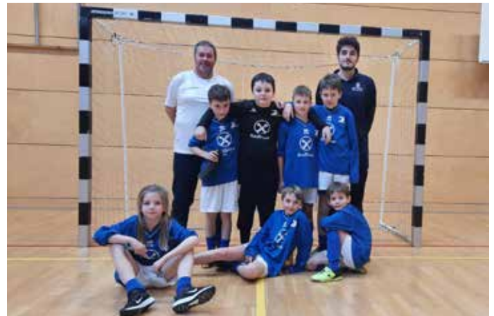
U9 in Tramin