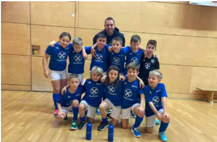
U8 in Tramin