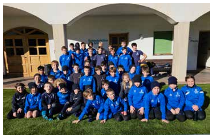
Internes Vereinsturnier der Jugendmannschaften