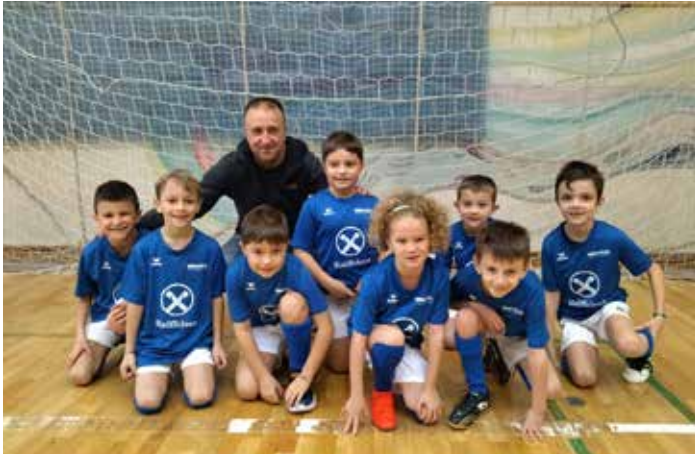
U8 Funino 2 in Eppan