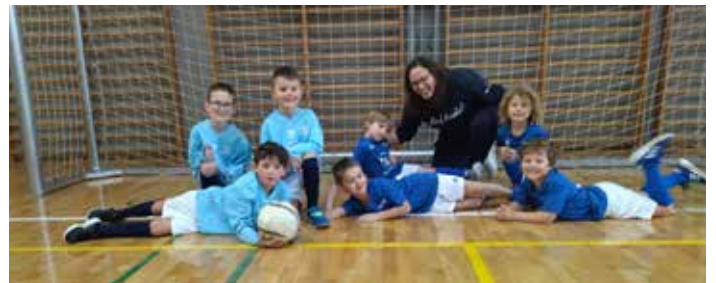
U6 Funino1 in Eppan