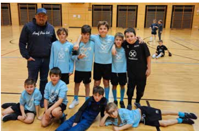
U10 in Tramin