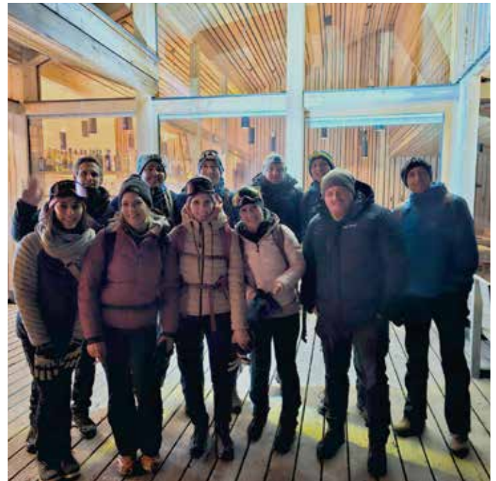
Das OK-Team hatte samt Helfern beim Nachtrodeln in Reinswald einen Mordsspaß.