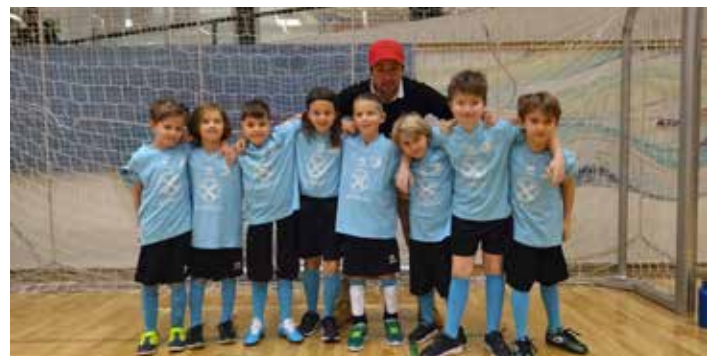
U8 Funino1 in Eppan