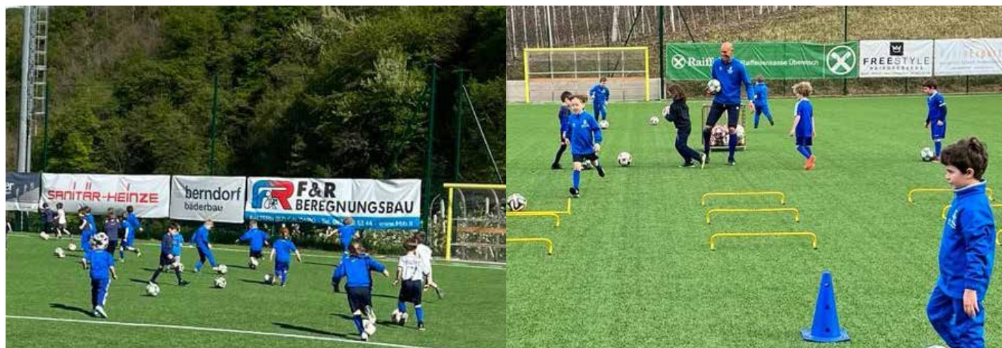
Die U-6 im Training

Meistens gestaltet es sich so, dass wir einen kleinen Parkour aufbauen, an dem die Kinder viel Spaß haben. In diesem Alter geht es natürlich nicht nur um den Fußball, sondern auch um das Laufen und die Koordination. Sie müssen unter einer Hürde durchrennen oder drüber springen. Anschließend treffen wir uns im Kreis und