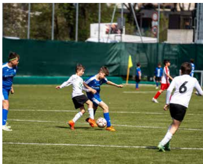
Cordial Cup in Passeier: Unsere U-10 im Einsatz

Leider gab es bei der U-10 gleich mehrere krankheitsbedingte Ausfälle, weshalb die Mannschaft mit einem Minikader am Turnier teilnahm und insgesamt sieben Spiele bestritt. Nach drei Siegen, drei Niederlagen und einem Unentschieden reichte es letzten Endes für den 19. Endrang von 24 Mannschaften. Die U-12 dagegen verpasste eine kleine Sensation knapp. Nur aufgrund der schlechteren Tordifferenz verpasste sie den Einzug in das Viertelfinale. Das Platzierungsspiel gewannen die Jungs dann aber, womit sie den 9. von insgesamt 16 Plätzen belegten.