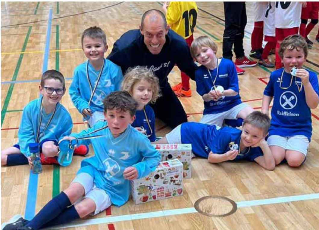
Die U-6 beim Hallenturnier in Eppan

Turnier-Erfahrung sammeln. Das Funino-Format ist stark im Kommen und ist eine gute Gelegenheit für junge Kinder im Turniermodus gegeneinander zu spielen. In den Trainings spielen wir natürlich regelmäßig nachdem Parkour Fußball. Dafür werden die Kinder in Gruppen eingeteilt, damit der Leistungsunterschied nicht ganz so groß ist.