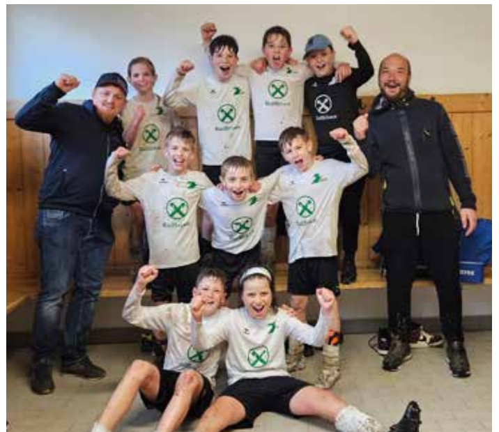
Die U10-Mannschaft bestreitet in St. Lorenzen ein Quali-Turnier für das Halbfinale, das am Mittwoch, 5. Juni stattfinden würde