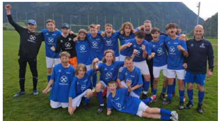
Die U13-Mannschaft ist für das Halbfinale in Rungg gerüstet.