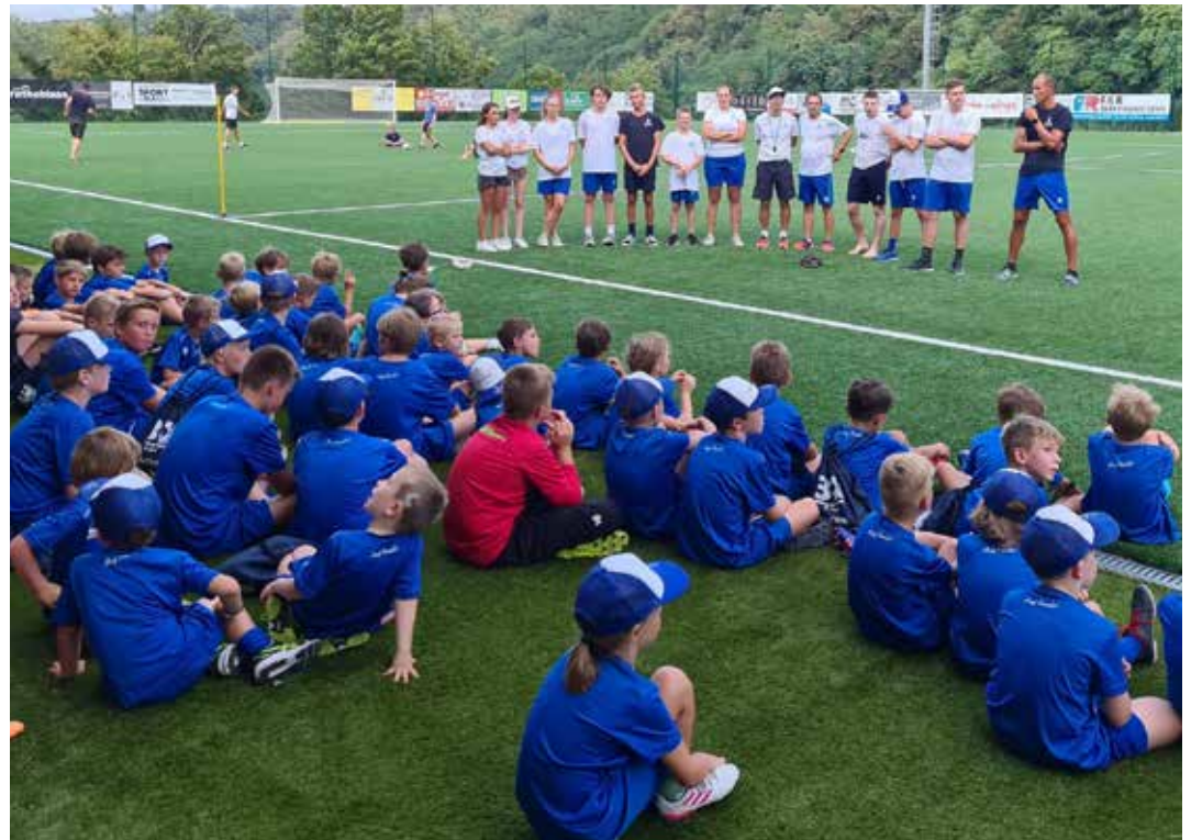
Sommerncamp: Vom 22. bis zum 26. Juli geht es auf dem Paulsner Fußballplatz wieder rund.

vitäten stehen auf dem Programm. Wie groß das Interesse ist, zeigt, dass das Camp bereits jetzt mit 103 Teilnehmern restlos ausgebucht ist.