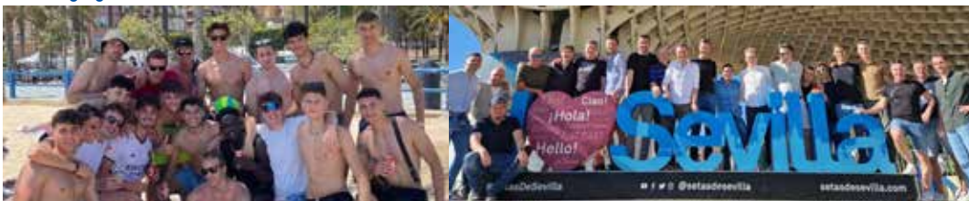
Stählen ihre arg strapazierten Muskeln und Sehnen unter spanischer Sonne: Die Paulsner Oberligaspieler (links) und jene der Paulsner Freizeit (rechts).

Auf die Südtiroler Sportvereine warten in den nächsten Wochen und Monaten zahlreiche außerordentliche Vollversammlungen. Der Grund ist, dass der italienische Gesetzgeber und mit ihm das Nationale Olympische Komitee CONI die Anerkennung der Vereine als sogenannte Società di Promozione Sportiva, also als Sportförderungsorganisation, durchsetzen will. Das bringt erhebliche Steuervorteile mit sich und soll auf lange Sicht auch in bürokratischer Hinsicht Vorteile bringen. Deswegen müssen die Vereinsstatuten des FC entsprechend angepasst werden, was die Vollversammlung im Beisein eines Notars beschließen muss. Der FC St. Pauls wird ebenfalls eine solche Vollversammlung abhalten müssen, der genaue Zeitpunkt und Ort werden zu gegebenem Zeitpunkt im Gemeindeblatt bekannt gegeben.