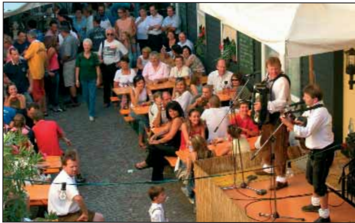
Ein toller Blick in den Innenhof des Anzitzes Schreckenstein während des Frühschoppenkonzertes des Casal-Duos. Obwohl Frühschoppen ein relativer Begriff ist...die Casal-Mander spielten einmal mehr bis um 17 Uhr nachmittags.