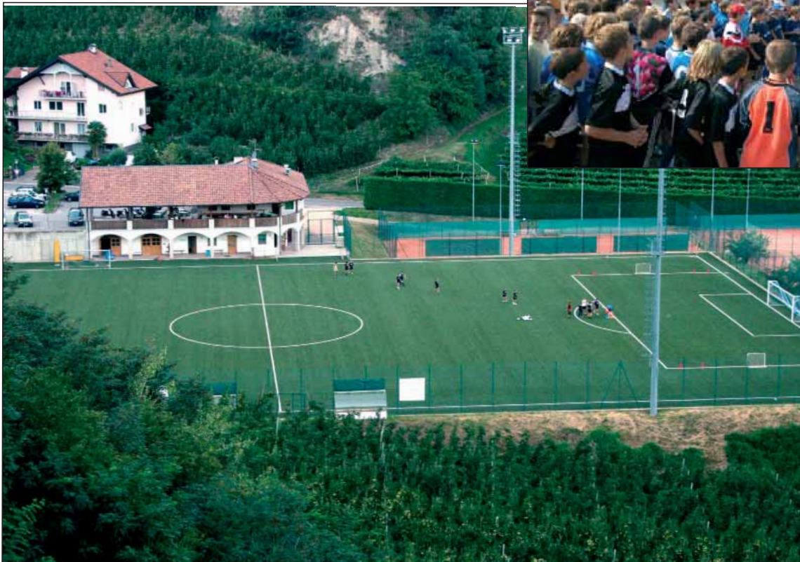
Ein toller Anblick: Der neue Kunstrasenplatz in St. Pauls