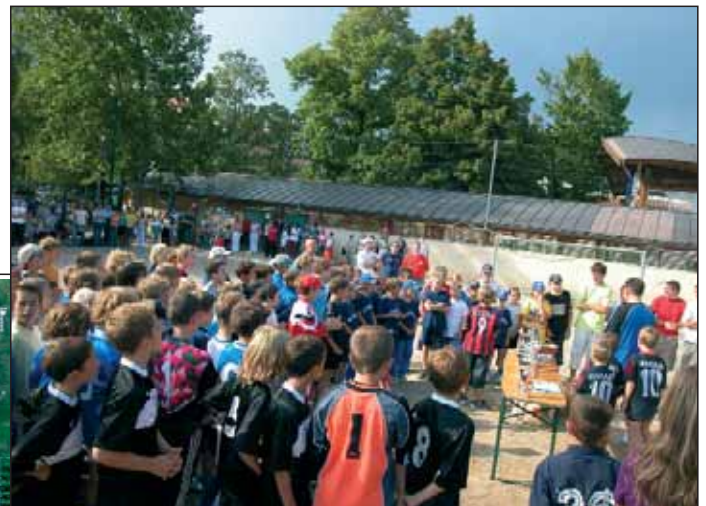
Preisverteilung des letztjährigen Turnieres.

Gruppe E SG Schlern SSV Brixen ASV Tramin II ASV Ulten