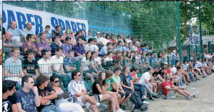
Seit Jahren ein Zuschauerhit - das Paulsner Kleinfeldturnier.

am Samstag, 17. Juli über den ganzen Nachmittag und Abend. Die Teilnehmerzahl ist auch heuer begrenzt. Deshalb: Wer am größten Kleinfeldturnier Südtirols teilnehmen möchte, sollte sich so schnell als möglich anmelden. Anmeldungen werden unter Telefon 339-