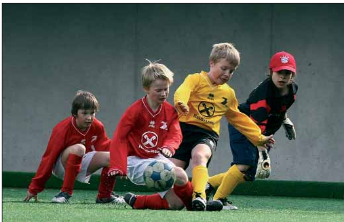
Spannende Spiele und knappe Entscheidungen sind beim 33. VSS-Finaltag am Sonntag, 6. Juni in Rungg zu erwarten. Das erste Spiel wird um 9.15 Uhr angepfiffen, das letzte um 16.45 Uhr mit dem Landesfinale der Unter 15.